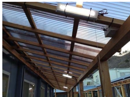
LED 設置例（大槌町仮設庁舎）