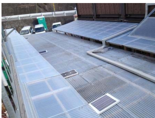
ソーラーパネル設置の一例